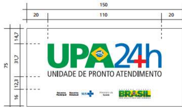
MODELO X – TERMO DE REFERENCIA

Item 09 - 03 unidades, em chapa metálica, tamanhos: duas placas com 5,50m de largura x 2,70m de altura e uma placa com 1,70m de largura x 2,70m de altura.