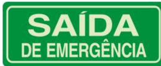
MODELO IX – TERMO DE REFERENCIA

MODELO DE PLACA – SAÍDA DE EMERGÊNCIA – Tamanho 20 x 10 cm. Para atendimento ao item 07 do Termo de Referência: